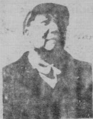
EL PRESIDENTE MAO TSE TUNG, LIDER INDISCUTIBLE DEL PUEBLO CHINO Y GRAN DIRIGENTE DEL PROLETARIADO MUNDIAL.

La marcha del pueblo chino hacia su liberación ha sido larga y dura, sus sacrificios innumerable, pero sólo esa lucha persistente y tenaz han hecho posible su felicidad actual. Hoy el proletariado y el pueblo chinos, con su Partido Comunista al frente y presidido por su gran líder Mao Tsé Tung, elevan constantemente su conciencia política, su movilización y vigilancia revolucionarias, para avanzar en las conquistas de la revolución socialista.