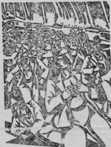
FASCISMO: IMPERIO DEL TERROR

E sto es lo que han hecho hasta ahora. Si queremos saber para que se preparan y cuales son sus proyectos, basta mirar a la reciente disposición del Ministerio del Ejército mediante la cual ningún recluta podrá hacer el servicio militar en la región en que vive, incluidos los voluntarios. Es evidente que esta medida tiene un claro sentido: la utilización del