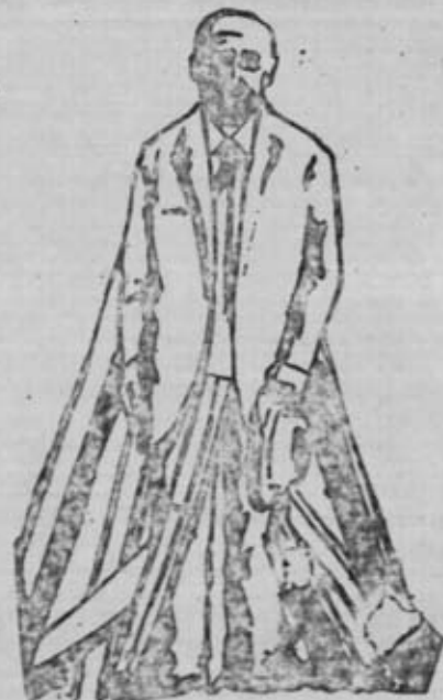
LOS OBISPOS APUNTALAN AL RÉGIMEN DE FRANCO, EN VEZ DE AYUDAR AL PUEBLO A DEBARRIBARLO, AHORRANDOLE LOS SUFRIMIENTOS QUE LE PRODUCE TAN SANGUINARIA DICTADURA.

En resumen, la nota de los obispos de la Comisión Permanente del Episcopado, finge ignorar que el decreto del terrorismo vaya dirigido contra la clase obrera y el pueblo y presta el apoyo y la colaboración más descarada al fascismo, haciendo caso omiso de la petición de condena del Régimen que pide el pueblo de España y las masas católicas. Una y otra vez la jerarquía eclesiástica desoye los llamamientos para que se sume al campo democrático, y condene públicamente al régimen terrorista de Franco. En estos momentos no hay nadie ya que pueda navegar entre dos aguas, y, o bien pasa al campo democrático, o actúa de cómplice y testafuro de la bárbara dictadura de Franco que se tambalea, para apuntalarla, para retrasar su caída, alargando de este modo los sufrimientos que el pueblo tiene que soportar bajo tan sanguinario sistema. ●