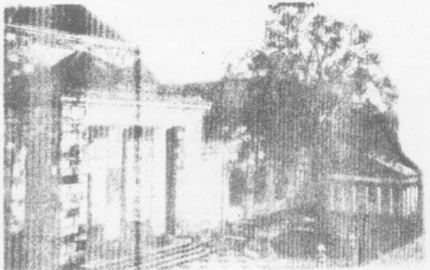
Arbol de Guernica, símbolo de Euskadi