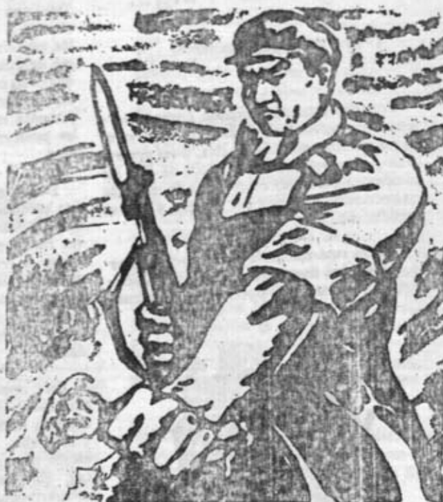
CARTEL EN EL QUE EL PUEBLO TRABAJADOR CHINO DENUNCIA A TENG SIAO-PING

Con motivo de los sucesos del 5 de abril en la Plaza de Tien An-Men de Pekín, y de la posterior destitución del viceprimer ministro Teng Siao-Ping, casi la totalidad de la prensa burguesa española e internacional ha disparado sin freno, hablando de intrigas palaciegas y de luchas personales por el Poder en China y sacando las conclusiones más falsas y peregrinas.