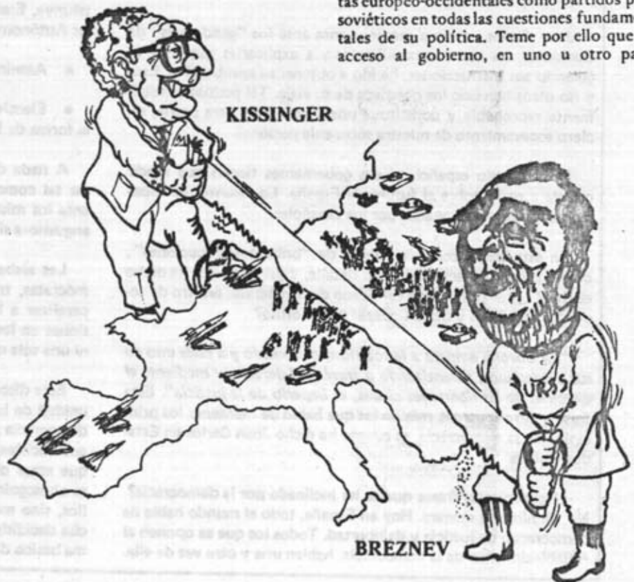
LA "DOCTRINA SONNENFELDT": UN PLAN PARA REPARTIRSE EUROPA

La razón principal de estas advertencias es que el actual gobierno norteamericano considera a estos Partidos Comunistas europeo-occidentales como partidos prosoviéticos en todas las cuestiones fundamentales de su política. Teme por ello que su acceso al gobierno, en uno u otro país,