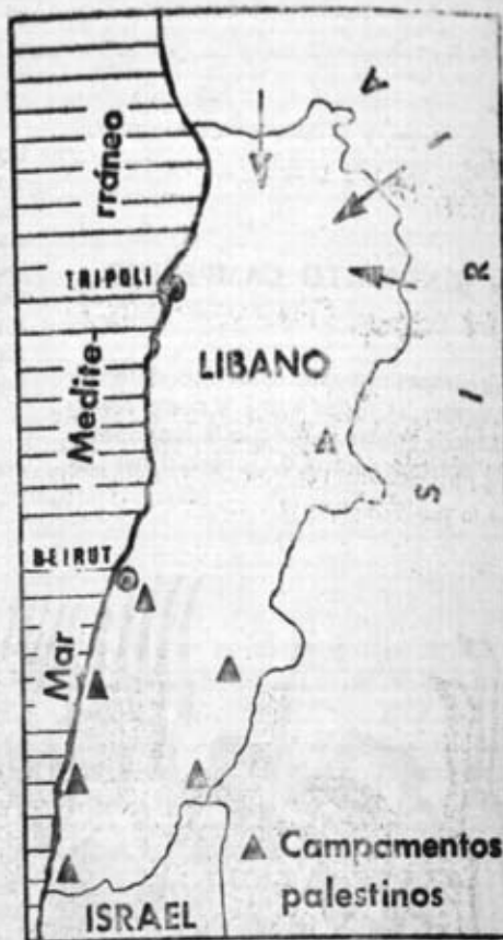
LAS FLECHAS INDICAN LAS ZONAS DE PENETRACION DEL EJERCITO SIRIO EN TERRITORIO LIBANES.

Por ello, Israel lleva años desatando furiosos ataques contra todo el Sur del Líbano, donde se encuentran la mayor parte de los campamentos de refugiados palestinos. La reacción y el gobierno libaneses ante estos ataques, en lugar de organizar una defensa nacional capaz de hacer frente a estas agre-