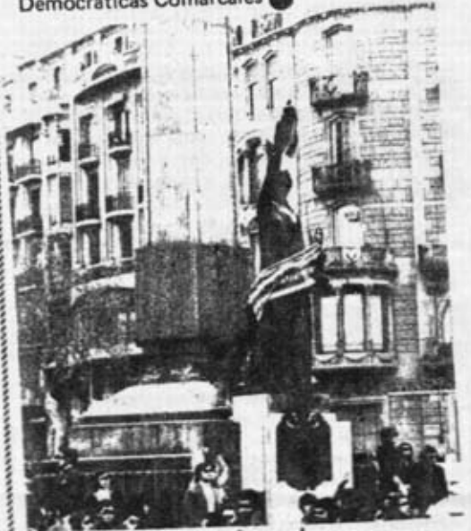
Colocando banderas en la plaza del Cinc d'Oros

La trascendencia y masividad de esta jornada se refleja en la participación de todas las comarcas catalanas: Barcelona, Tarragona, Gerona, Lleida, Penedés, Osona, Baix Ebre, Vallés, etc. que acudieron a manifestarse en respuesta a la convocatoria de los núcleos de la Asamblea de Catalunya en las diferentes comarcas: las Asambleas Democráticas Comarcales ●