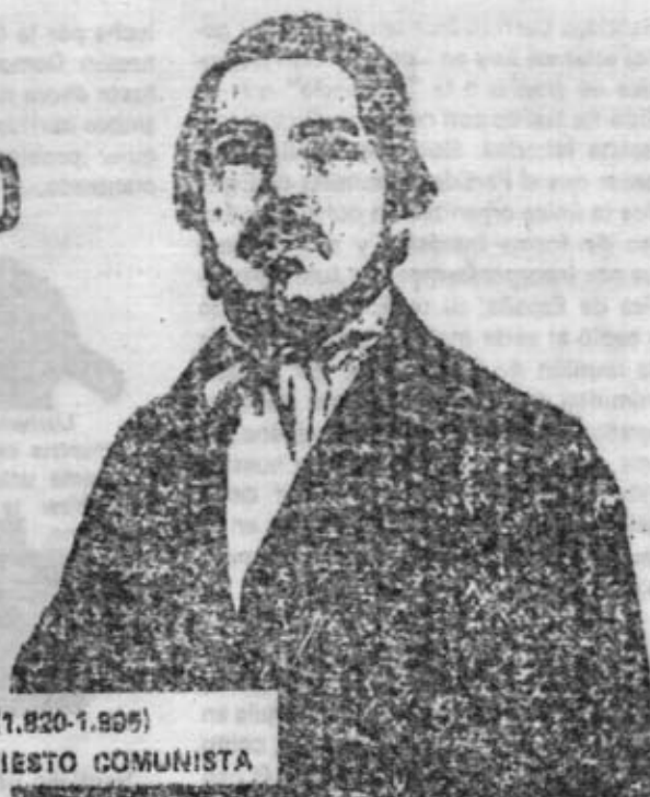
FEDERICO ENGELS (1.820-1.895) EN LA EPOCA DEL MANIFIESTO COMUNISTA

Q UE lumbrera intelectual se ha apagado! ¡Qué corazón ha dejado de latir! ". Con estas palabras hace 81 años comenzaba Lenin un pequeño folleto escrito en memoria de Federico Engels. Efectivamente, porque días antes, el 5 de agosto de 1.895, había muerto Federico Engels, el inseparable compañero de Carlos Marx, su continuador más directo; el hombre cuyo apellido permanece indisolublemente unido al del fundador del marxismo, y que junto al mismo Marx, Lenin, Stalin y Mao Tsé-tung forma el grupo de los cinco grandes líderes del movimiento comunista internacional y del proletariado mundial.