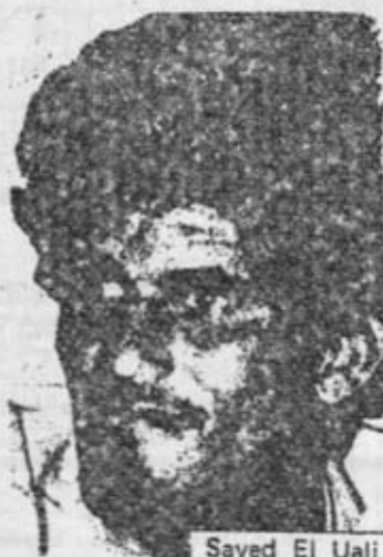
Sayed El Uali

"En nombre del Comité Central del Partido del Trabajo de España saludo calurosamente a este III Congreso del Frente Polisario y a todas las delegaciones aquí presentes, y os expreso una vez más nuestro total apoyo a vuestra justa lucha por devolver al pueblo saharaui la libertad y la soberanía. El pueblo saharaui es un pueblo valiente y decidido a conquistar su libertad, que ha combatido contra el colonialismo español y que ha empuñado las armas frente al invasor sin escatimar sacrificios como lo está demostrando cada día.