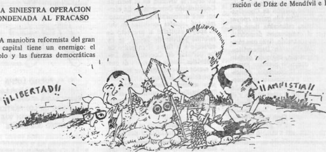
EL BLOQUE FORMADO POR FRAGA, LOPEZ RODO, MARTINEZ ESTERUELAS, SILVA-MUÑOZ Y FERNANDEZ DE LA MORA ES EL BLOQUE DE LA ESPAÑA NEGRA DEL PASADO

L A maniobra reformista del gran capital tiene un enemigo: el pueblo y las fuerzas democráticas