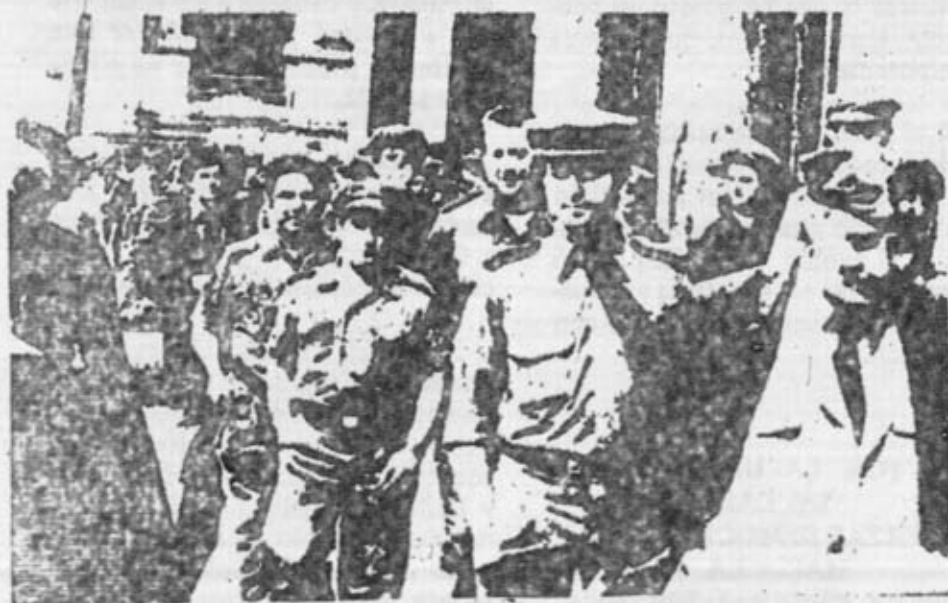
UNA IMPORTANTE MOVILIZACION: LA HUELGA DE LOS CARTEROS

Buró Político del Comité Central del Partido del Trabajo de España.