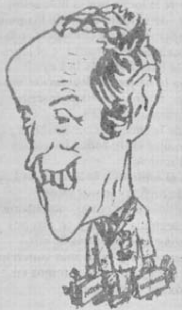
LOPEZ BRAVO, UNO DE LOS PRINCIPALES ENCARTADOS EN LOS SOBORNOS DE LA LOCKHEED, Y QUE YA TUVO DESTACADA PARTICIPACION EN EL "CASO MATESA"

"Irregularidades sí, sobornos no"; con tan significativas palabras se expresó el fiscal del Tribunal Supremo —que precisamente unas horas más tarde presentaría su dimisión— en el exiguo informe que proporcionó a la prensa, 750 palabras en total, acerca de los sobornos repartidos por la empresa aeronáutica norteamericana Lockheed entre diversos altos cargos del Estado, con el objeto de asegurar la venta de siete aviones de transporte militar destinados al ejército español.