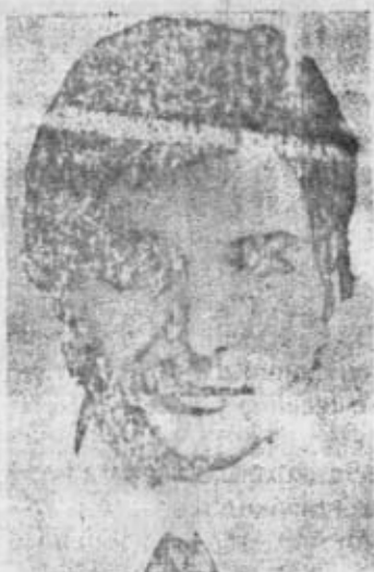
LAS ELECCIONES Y LA CUESTION NACIONAL DE CATALUNYA. Por Joaquín Badía pág.10