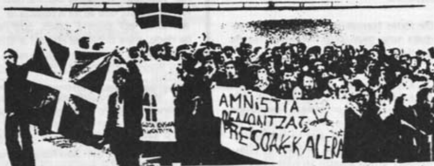
5.000 manifestantes por la amnistía en Anoeta durante la celebración de los campeonatos de Europa de atletismo