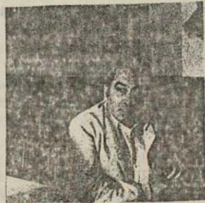
Nicolás Redondo. Secretario General