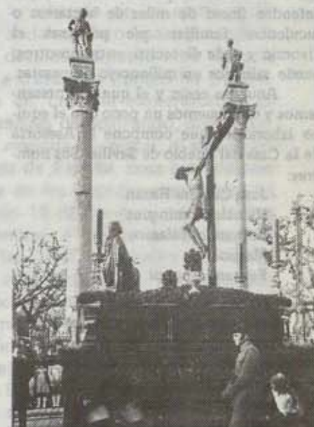
La están crucificando

Pero aquí no queda la cosa, con el proyecto de la Cartuja, este alcalde, que de seguro pasa a la historia, ha puesto sus