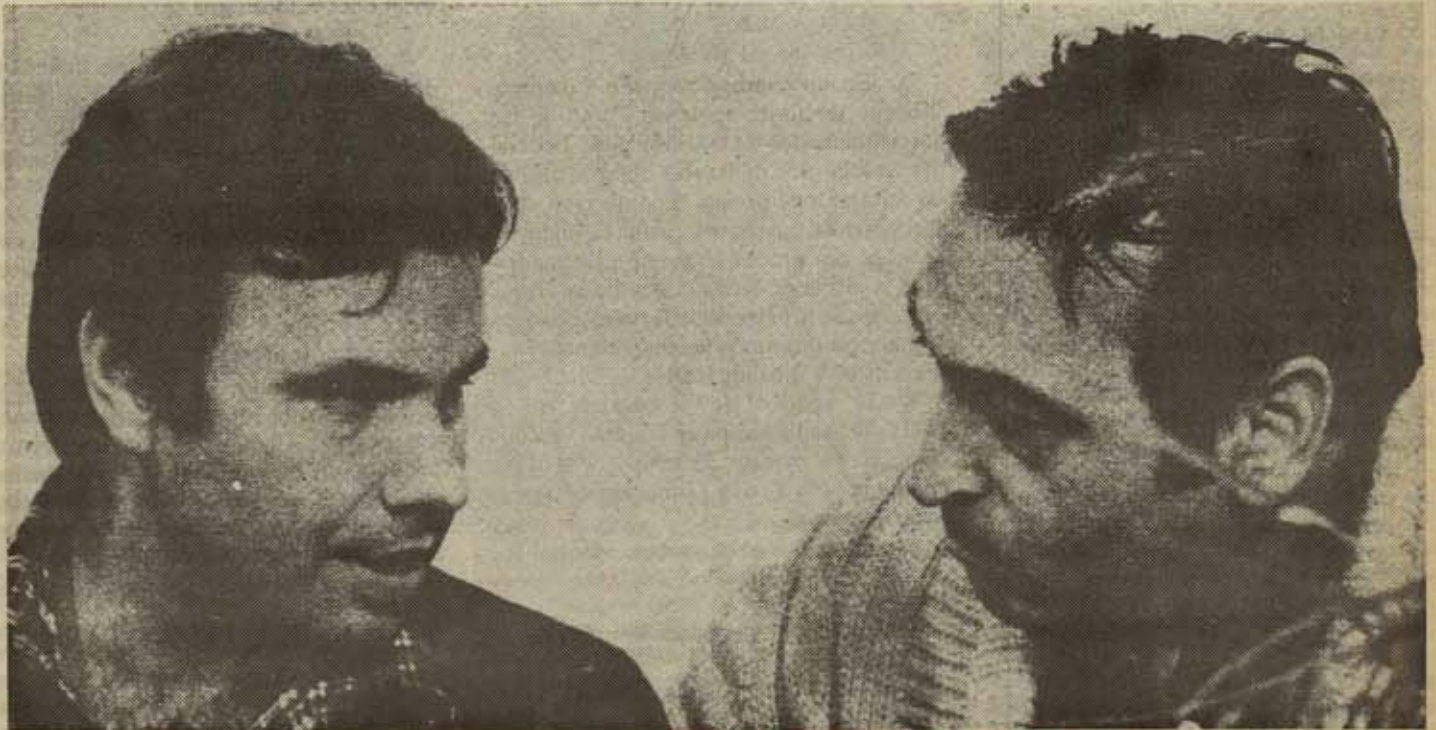
SINDICALISMO Y POLITICA POR UN MISMOS OBJETIVO : EL SOCIALISMO

Honestamente creemos que el mejor servicio que hoy se le puede prestar a nuestra clase es consolidar el sindicalismo libre, y estamos convencidos que el proceso de elecciones que se avecinan es una ocasión inmejorable para llevarlo a cabo.