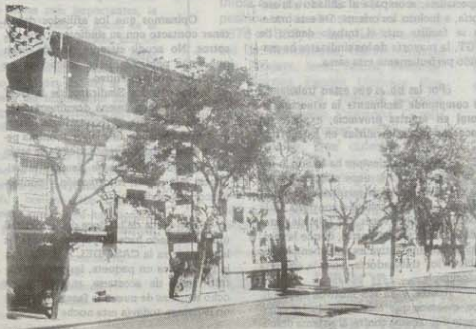
"destruye, que algo queda"