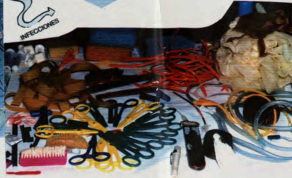
Instrumental aparecido en lavandería mezclado con la ropa sucia.