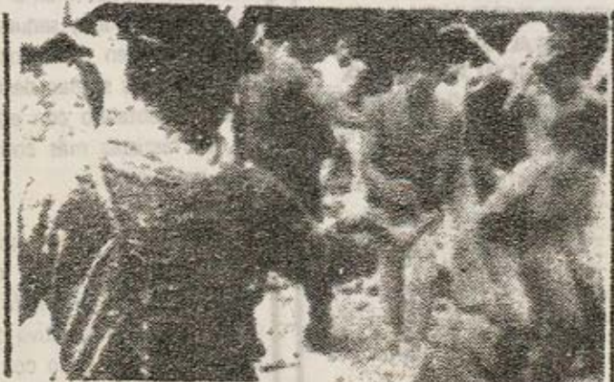
En Tailandia el terror fascista actua como en todas partes.

La brutalidad y sadismo empleados en el golpe, es inenarrable. Hombres y mujeres, en su mayoría jóvenes, han sido torturados, bañados, quemados, linchados... Todo ello, según los autores del golpe en defensa de la Monarquía.