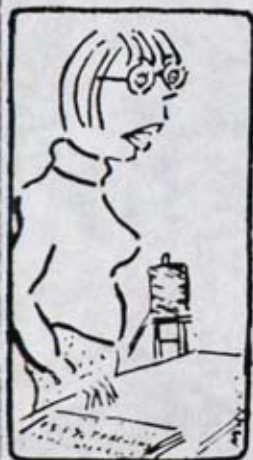
— Hoy, niños, vamos a aprender cómo llenar el cuestionario del desempleo.