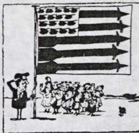
"¡Vista a la derecha!" "Basler Zeitung", Suiza.