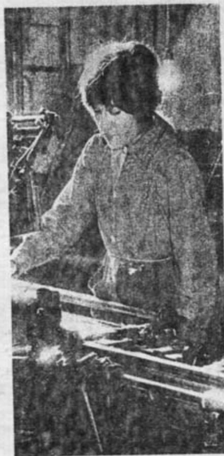
La mujer se incorpora al trabajo... y a la lucha

Fué una reunión que bien pudo ser un programa de lucha de todas las mujeres de Sevilla.