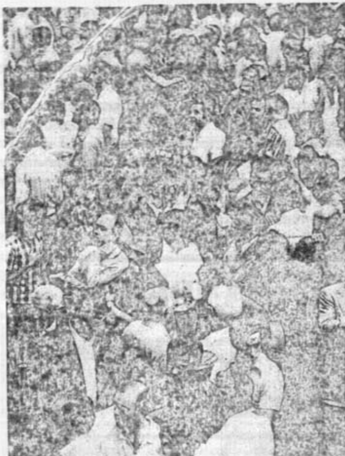
saben el camino

teada la oposición democrática en la provincia de Sevilla y en Andalucía entera. — Estas tareas se deducen de lo anterior.